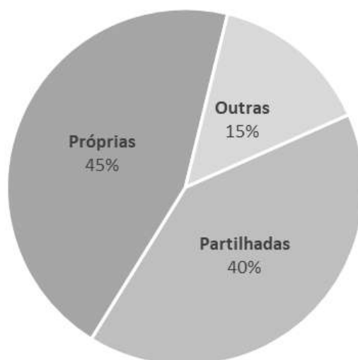
Gráfico 1 - Origem dos conteúdos publicados pelo PNC nos espaços das suas redes sociais em 2020.

PNC), as publicações Partilhadas (conteúdos existentes noutros espaços das redes sociais) e as Outras publicações (conteúdos partilhados por outras pessoas).